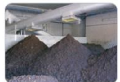
Automatic cake storage