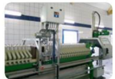
Automatic cake discharge boom