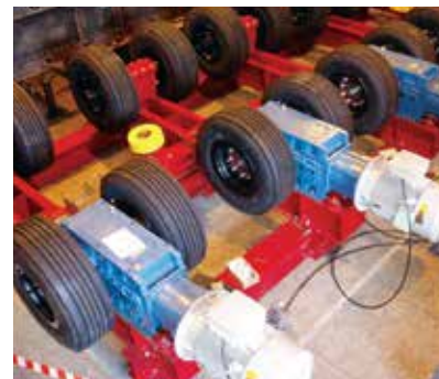
Sistema de Acionamento com pneus Sepro (PTD)