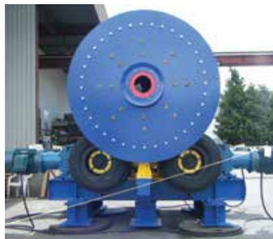
Moinho de bola Sepro 1.8 x 3.6